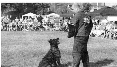
Holländischer Schäferhund Club in Hanau

ser Rassehund" - Das Magazin des VDH - Ausgabe 09/13